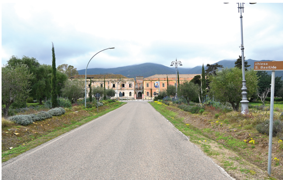
Fig. n. 10 - Il viale d'accesso alla colonia disegna una scenografica fuga prospettica, il cui punto di fuga, inquadrato dai due Corpi di Guardia, coincide con il torrino al centro della corte.