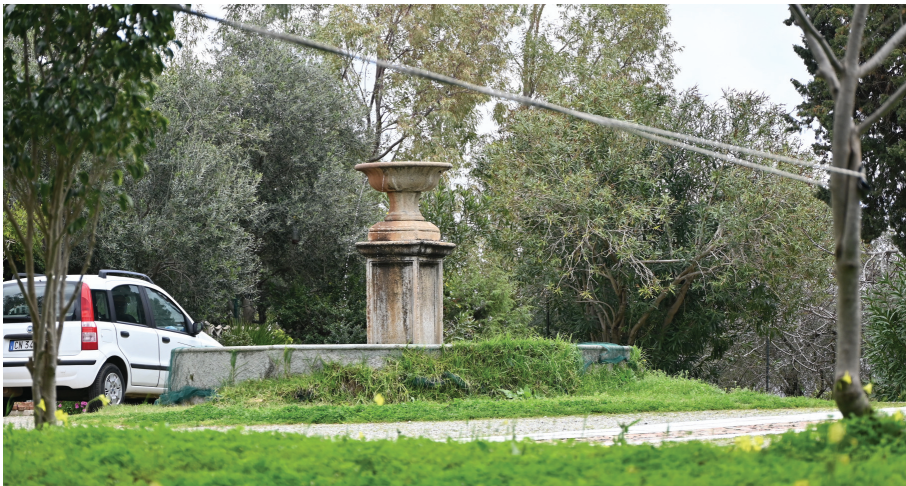
Fig. n. 13 - La fontana realizzata in prossimità dell'Asilo, della villa della Direzione e del Caseificio. La presenza e il funzionamento continuo della fontana presuppongono la realizzazione di una rete idrica all'interno della colonia, collegata ad un acquedotto.

Si provvede, nel frattempo, all'approvvigionamento idrico e a razionalizzare il sistema viario da e per la colonia: una nuova strada, embrione dell'attuale Provinciale n. 20, collega il penitenziario alla Statale Orientale Sarda in prossimità dell'abitato di San Priamo. L'intervento rientra in un piano di largo respiro, attuato nel 1899, per il quale la Colonia di Castiadas occupa la posizione baricentrica nei collegamenti tra l' Orientale Sarda e la litoranea tra Cagliari e Villasimius 50 .