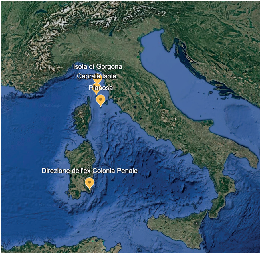
Fig. n. 3 - Il complesso carcerario di Castiadas nel quadro delle Colonie Penali italiane realizzate a cavallo dell'Unità d'Italia.

idealizza l'archetipo del perfetto imprenditore agrario: superando il modello del piccolo fondo rustico, il direttore coordina un'azienda diversificata e recluta in prima persona le figure specializzate indispensabili al suo funzionamento, in primis gli agronomi. Unico canale di dialogo con lo Stato, il direttore incarna la figura del padre protettore, al pari degli industriali illuminati dei villaggi operai, accentuando le affinità tra queste piccole comunità produttive e le Colonie Penali 7 .