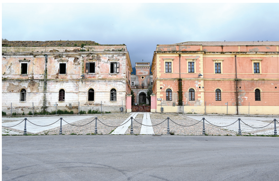
Fig. n. 7 - Vista dei due Corpi di Guardia dalla piazza antistante il penitenziario. Il linguaggio classicista, di marca palladiana, deriva, forse, da precise indicazioni ministeriali, finalizzate all'adozione di un'estetica condivisa fra le architetture istituzionali del giovane Regno d'Italia.