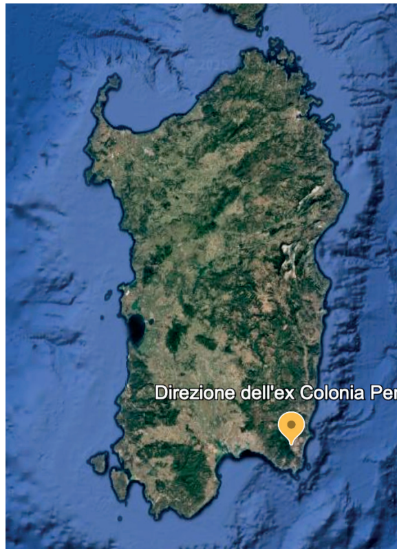
Fig. n. 1 - La Colonia Penale Agricola di Castiadas sorge nella Sardegna sud-orientale, nella regione storica del Sarrabus.

inserita in un contesto di mercato 4 . Ciononostante, la crescita costante della colonia rivela differenze significative rispetto alla maggior parte dei complessi destinati ai lavori forzati, spesso dislocati su isole remote, nei quali l'obiettivo primario di allontanare i rei dalla società civile travalica il recupero morale del detenuto. In questa direzione, si muove il Granducato di Toscana, cui si deve l'introduzione del modello detentivo coloniale fra gli stati preunitari nell'isola di Pianosa (1858), poi applicato dal Regno d'Italia nelle isole di Gorgona (1869) e Capraia (1873) [Fig. 3] 5 .