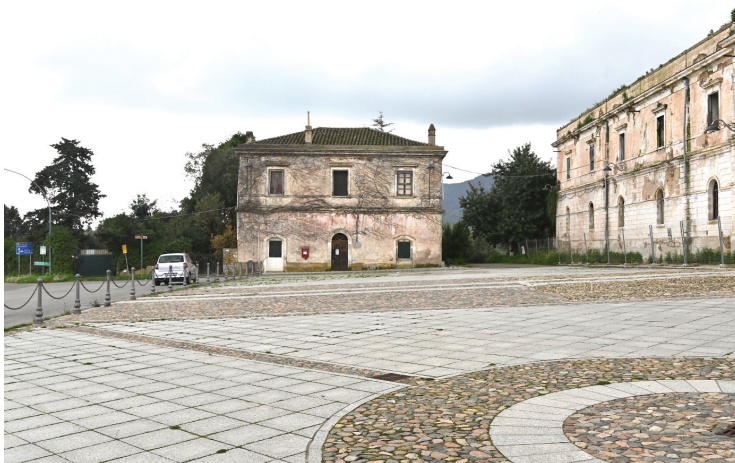
Fig. n. 9 - Uno dei due edifici simmetrici posizionati ai lati della piazza, in origine probabile alloggio dell'agronomo.