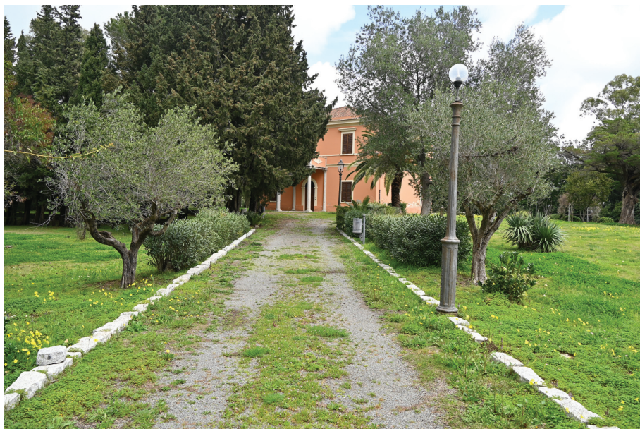
Fig. n. 12 - La villa della Direzione sostituisce, o si affianca, funzionalmente, al primo edificio direzionale sorto all'interno della corte centrale.

Il Governo mira, però, ad un altro, importante obiettivo: consolidare il sentimento nazionale, minacciato dalla recente unificazione politica e dalla sovrabbondanza di specificità locali, distribuite lungo lo stivale e nelle isole. Elaborare un lessico architettonico di Stato, chiaro e riconoscibile, è un paradigma imprescindibile, perfino nelle strutture carcerarie: i cittadini, davanti ad un'opera di servizio, sia anche di natura detentiva, devono scorgere l'azione sicura e tutelatrice dell'autorità pubblica. Non a caso, gli edifici della Colonia di Castiadas adottano linee estetiche comuni alle nuove fabbriche di Stato e municipali. Un sobrio, ma elegante Classicismo, di vaga matrice palladiana, caratterizza la pletora di sedi civiche, casamenti scolastici, caserme, campi santi, penitenziari edificati dopo l'Unità d'Italia. I governi succedutisi alla guida del paese intuiscono i contenuti di questa vasta campagna edilizia ed elaborano misure economiche adeguate a sostenerla: si pensi alla nascita della Cassa Depositi e Prestiti, istituto destinato a supportare gli investimenti pubblici nel paese attraverso il risparmio postale. La Sardegna partecipa a questo intenso e capillare programma edilizio, come testimoniano le affinità estetiche tra le architetture della colonia di Castiadas e il carcere cagliaritano di Buon Cammino, linguaggio comune a tante opere pubbliche ottocentesche