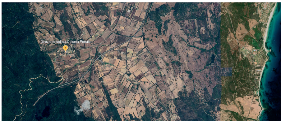
Fig. n. 2 - Il paesaggio agrario odierno attorno all'ex penitenziario deriva dalla parcellizzazione fondiaria, dalle colture e dalle infrastrutture realizzate al servizio del carcere.

La Colonia di Castiadas, infatti, pur nascendo in un territorio all'epoca disabitato, è concepita come un'unità produttiva integrata nel paesaggio del Sarrabus, regione storica della Sardegna sud-orientale, proponendosi come volano per la bonifica e la riorganizzazione dell'agro circostante. Sotto questa prospettiva, il complesso carcerario anticipa il corpus legislativo italiano di fine Ottocento, di cui intercetta i futuri indirizzi. Per i giuristi d'Età Umbertina, le colonie penali interne: «rappresentano l'ultimo perfezionamento del sistema penitenziario moderno, in quanto consistono in una maniera di esecuzione della pena principalmente indirizzata all'emenda» 6 . Nella visione del legislatore, il ruolo del direttore acquista competenze e prerogative nuove, estese all'architettura degli edifici detentivi, all'organizzazione agronomica e zootecnica della colonia, alla gestione economica, alla disciplina del detenuto, del quale stabilisce la durata della giornata lavorativa, l'alimentazione, la retribuzione. Il profilo descritto, pienamente calato nella cultura positivista ottocentesca,