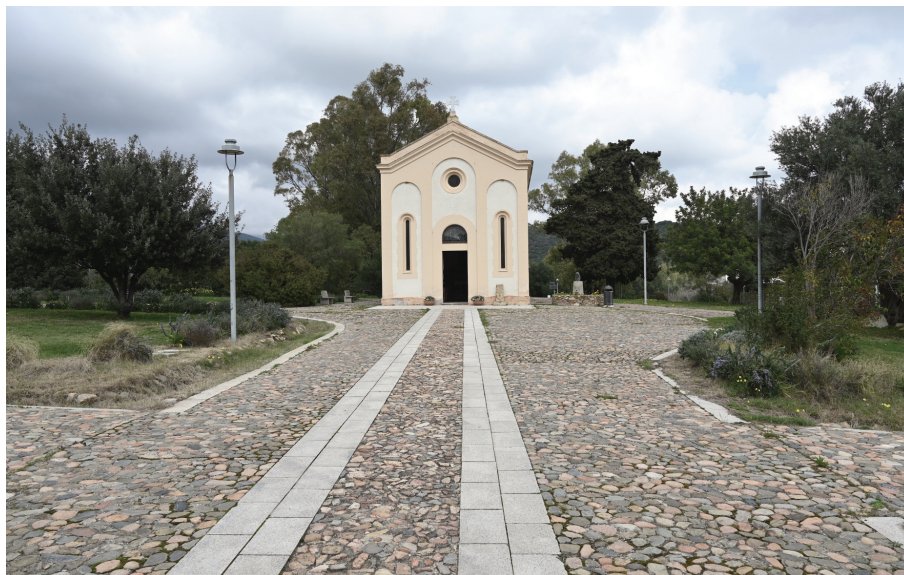
Fig. n. 11 - La chiesa di San Basilide, sorta a cavallo dell'anno 1900 accanto agli edifici più antichi della colonia..