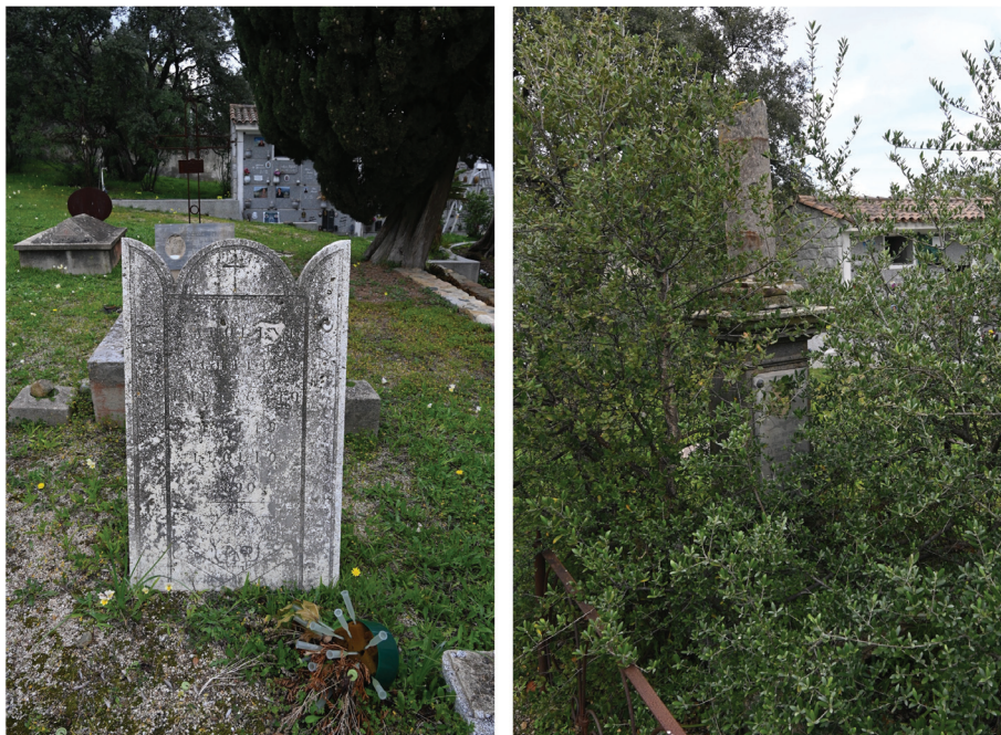
Fig. n. 14 - A breve distanza dai fabbricati, sorge il Campo Santo, nel quale sopravvivono alcune sepolture risalenti ai primi decenni di esistenza della colonia.