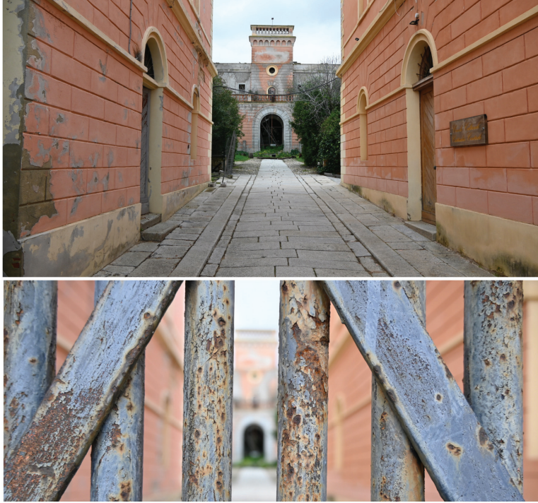
Fig. n. 8 - L'ingresso alla corte centrale della colonia, attraverso il varco tra i Corpi di Guardia. Sullo sfondo, il torrino sul corpo di fabbrica un tempo destinato alle celle di detenzione.